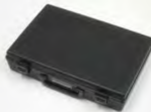
ヒンジ付き樹脂ケース 幅360×奥行270×高さ80mm