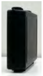
立てても置 けます