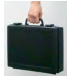
キャリング可能 で安全保管